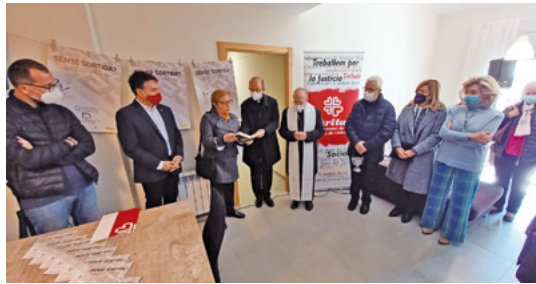
Benedicció de la Llar Iris

També per a Càritas Diocesana de Sant Feliu de Llobregat, la situació de les persones sense llar és un dels eixos de treball. És preocupant la precarietat habitacional que tantes persones que s'apropen a Càritas viuen. En aquest sentit, el testimoni d'anys de tots els homes que han passat pel Centre d'Acollida Abraham de Vilafranca, o pels pisos compartits d'arreu del bisbat, tant per homes i joves, dones o mares soles amb fills, ens apropen a una realitat que és crua, amb la qual treballem des